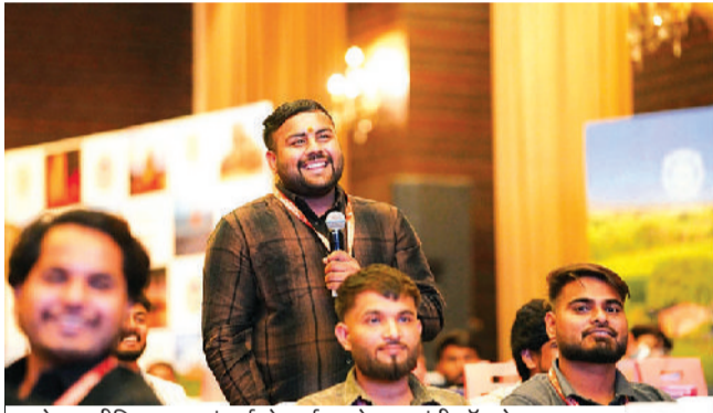
सोशल मीडिया इन्फ्लूएंसर्स से चर्चा करते मुख्यमंत्री डॉ. मोहन यादव।

मुख्यमंत्री डॉ. मोहन यादव ने कहा है कि सिंहस्थ-2028 का आयोजन आस्था, आध्यात्म और प्रकृति का अद्भुत समागम होगा। सिंहस्थ के मुख्य राजसी स्नान और अन्य स्नान शिप्रा के जल से ही हो, यह सुनिश्चित करने के लिए सिलारखेड़ी सेवरखेड़ी परियोजना प्रगतित है। वर्तमान दौर में सोशल मीडिया बहुत महत्वपूर्ण है, जो सुशासन और समाज को सकारात्मक दिशा प्रदान करने का सशक्त मार्ग है। डॉ. यादव मध्यप्रदेश पर्यटन विभाग द्वारा सिंहस्थ-2028 के कार्यों की जानकारी प्रदान करने प्रदेश के सोशल मीडिया इन्फ्लूएंसर्स की उज्जैन में आयोजित कार्यशाला को संबोधित कर रहे थे।