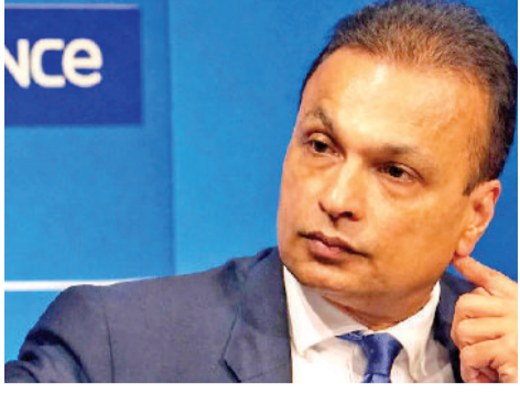
सेवकों के खिलाफ मामला दर्ज किया था। यह कार्रवाई भारतीय स्टेट बैंक (एसबीआई) की शिकायत पर की गई थी। आरोप है कि 2013-17 के दौरान समूह की कंपनियों के बीच

कथित गैरकानूनी लेन-देन के जरिए ऋण राशि का दुरुपयोग किया गया। इससे एसबीआई को करीब 2 हजार 929.05 करोड़ रुपये की हानि हुई, जबकि कुल जोखिम राशि 19 हजार 694.33 करोड़ रुपये थी। इस संयुक्त ऋणदाता समूह में 17 सार्वजनिक क्षेत्र के बैंक शामिल थे।