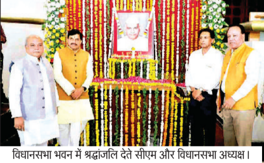
विधानसभा भवन में श्रद्धांजलि देते सीएम और विधानसभा अध्यक्ष।