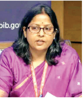
कमर्शियल उपभोक्ताओं को दी 11,300 टन एलपीजी

होर्मुज की खाड़ी के पूर्व और पश्चिम में है कुल 24 जहाज, उनमें सवार 636 भारतीय नाविक सुरक्षित हैं