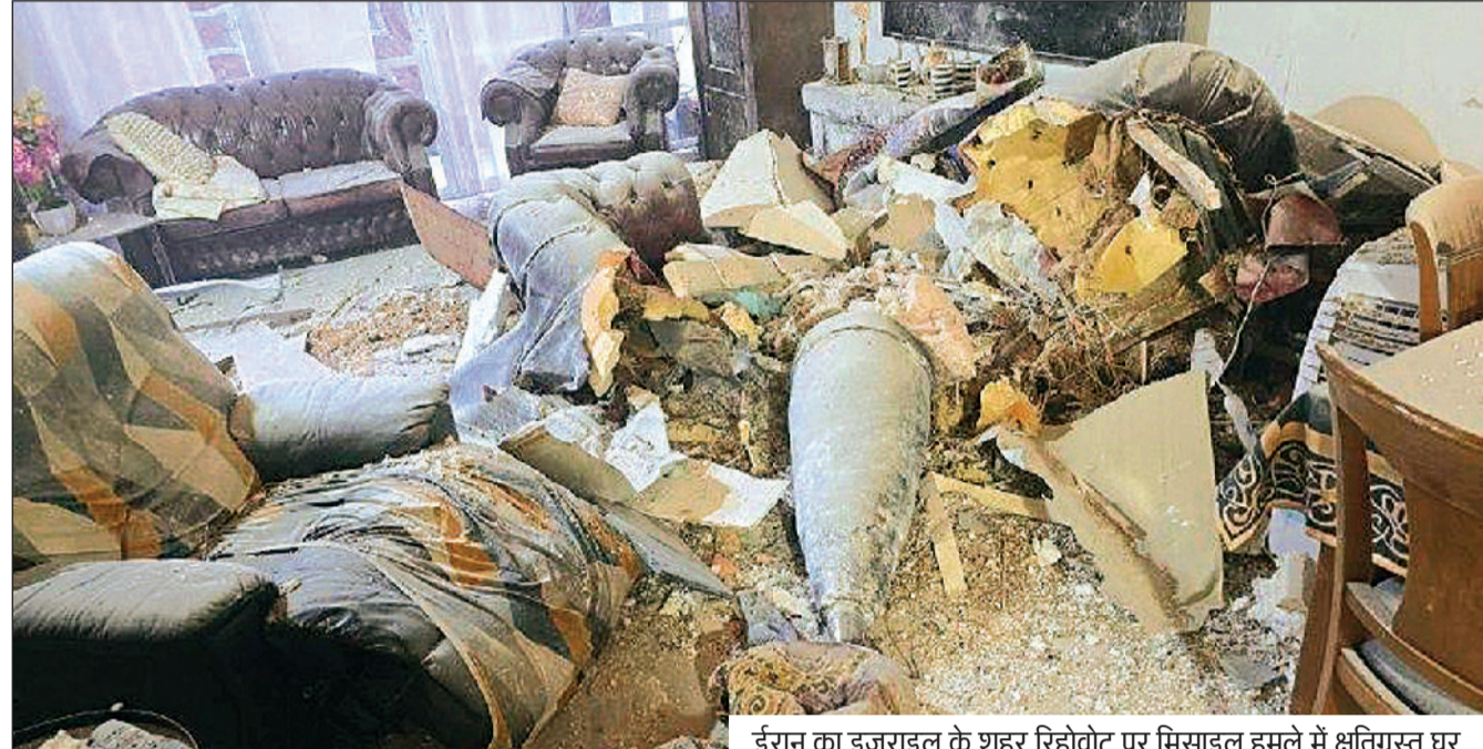
ईरान का इजराइल के शहर रिहोवोट पर मिसाइल हमले में क्षतिग्रस्त घर