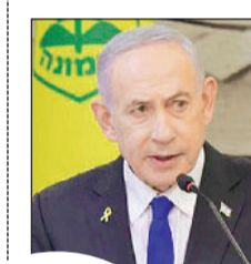
इजराइली पीएम बेंजामिन नेतन्याहू ने मीडिया के सामने आकर प्रेस वार्ता की।

नेतन्याहू ने सामने आकर की प्रेस वार्ता, दावा ईरान की परमाणु क्षमता खत्म, मिसाइल भी नहीं बना सकता