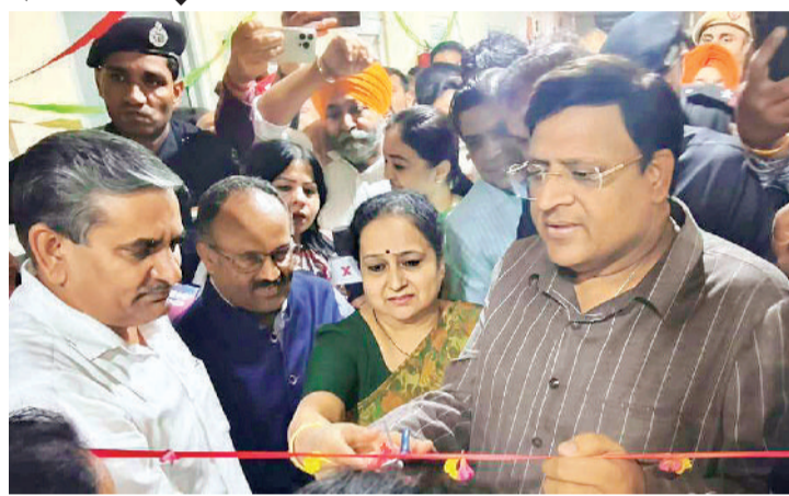
उन्होंने कहा कि लोकतंत्र में जनता की भागीदारी ही सबसे बड़ी ताकत होती है और जितनी अधिक भागीदारी होगी, उतना अधिक विकास संभव होगा।

उन्होंने बताया कि यमुना क्षेत्र में स्टोन पिचिंग तथा अन्य स्थायी कार्यों के लिए बड़ी योजना बनाई गई है ताकि हर वर्ष होने वाले