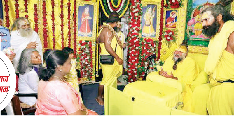
मथुरा-वृंदावन में राष्ट्रपति दौरे के दौरान सुरक्षा के कड़े इंतजाम किए गए थे

राष्ट्रपति द्रौपदी मुर्मू ने अपने दौरे के दौरान वृंदावन में प्रसिद्ध संत प्रेमानंद महाराज से मुलाकात की। शुक्रवार सुबह राष्ट्रपति श्री हित राधा केली कुंज आश्रम पहुंचीं, जहां उन्होंने प्रेमानंद महाराज के दर्शन किए और बातचीत की। राष्ट्रपति की इस यात्रा को लेकर पूरे मथुरा-वृंदावन क्षेत्र में सुरक्षा के कड़े इंतजाम किए गए थे। सुबह करीब साढ़े 7 बजे सुरक्षा के कड़े पहरे के बीच आश्रम पहुंचीं राष्ट्रपति मुर्मू की सादगी देखते ही बन रही थी। प्रेमानंद महाराज ने राष्ट्रपति को ब्रज की महिमा और सेवा भाव का महत्व समझाया।