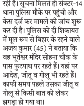
घायल युवक को उपचार के लिए अस्पताल भर्ती कराया गया, जहां उसकी हालत गंभीर बताई जा रही है।